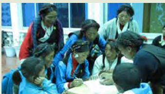
培训中心进行“潘得巴”项目培训