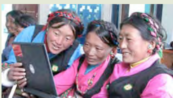
潘得巴培训学员在电脑前观看珠峰旅游宣传片