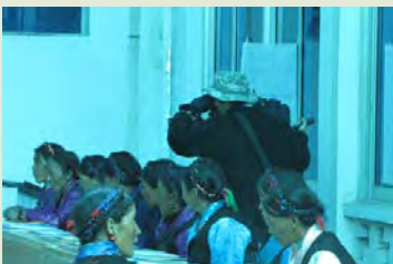
西藏电视台专赴培训现场报道 “潘得巴”

通过培训，学员们基本掌握了协会所安排的全部课程，对珠峰保护区的管理和建设状况、妇幼卫生保健、家庭创收、生态旅游与服务等领域有了进一步的了解。此次培训效果较为明显。