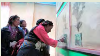
学员津津有味地观看珠峰保护区植物标本