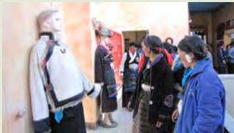
培训中心藏族服饰展厅