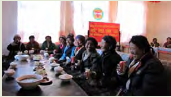
培训中心餐饮服务