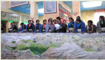
培训中心的珠峰自然保护区沙盘