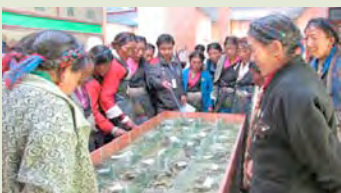
为学员介绍保护区内的植物物种