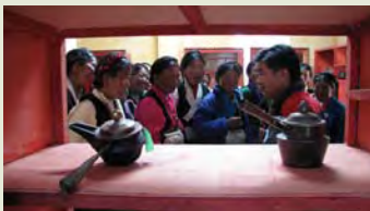
培训中心藏式器具展厅